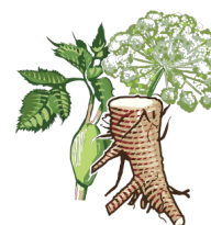
Raiz de Angelica