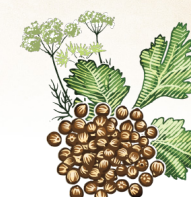
semente de coentro