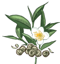
chá de pólvora

4 botânicos são adicionados à Vapor Basket