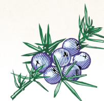
bagas de zimbro