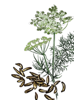
Semente de alcaravia